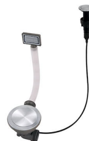
Automatischer Abfluss Space Push - PP 8407 116