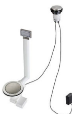
Automatischer Abfluss Space Light - PL 8407 117