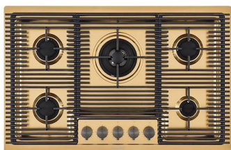
Kochfeld Milanello Gold 5F 7682 009