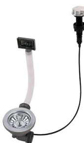
Automatischer Abfluss 8407 100