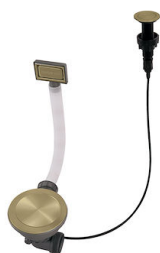
Automatischer Abfluss Space Push Gold 8407 121