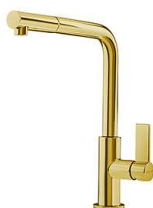
Mischbatterie Omega Plus Gold 8498 859