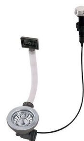
Automatischer Abfluss 8407 000